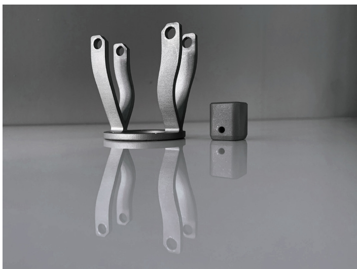
Bauteil Motorhalter

Die One Click Metal GmbH wurde 2019 gegründet und ist ein Industrie-B2B mit Sitz in Tamm nahe Stuttgart. Wir glauben, dass Technologien für jeden verständlich und nutzbar gemacht werden können. Darum vereinfachen wir unsere Produktlösungen so, dass jeder sie erfolgreich anwenden kann. Mit unserem Metall 3D Druck-System bedienen wir vor allem auch kleinere und mittelständische Unternehmen und sorgen so dafür, dass Metall 3D Druck-Technologien für die Allgemeinheit zugänglich werden. Daran arbeiten wir mit rund 20 Mitarbeitern und viel Motivation.